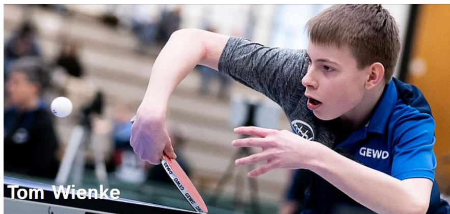
Herausragender Spieler beim nationalen Ranglistenturnier der Jungen-15

Der jährliche Auftakt der Jugend-Ranglistenspiele des Deutschen Tischtennis-Bundes (DTTB) beginnt mit den DTTB Top48 Turnieren. Hierbei spielen die Besten aus den Landesverbänden in den Jugendklassen U13, U15 und U19 um die Qualifikation DTTB Top24. Austragungsort im Oktober 2022 war Landsberg in Sachsen-Anhalt.