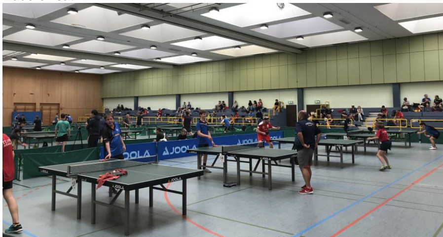
Kreissporthalle: Voller Spielbetrieb an 19 Tischen

Die dritte Auflage des Tischtennisturniers mit bundesweiter Ausstrahlung veranstaltete der TSV Nieder-Ramstadt über Pfingsten in Mühltais Kreissporthalle. Am Samstag wurden die Nachwuchs-Konkurrenzen ausgetragen, am Sonntag kämpften die Erwachsenen um Sieg und Platzierung. 19 Tische waren von 9 Uhr morgens bis abends im Dauereinsatz.