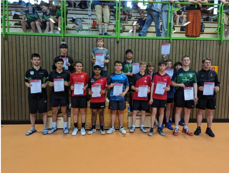
Siegerehrung BER 2023 Jungen 19