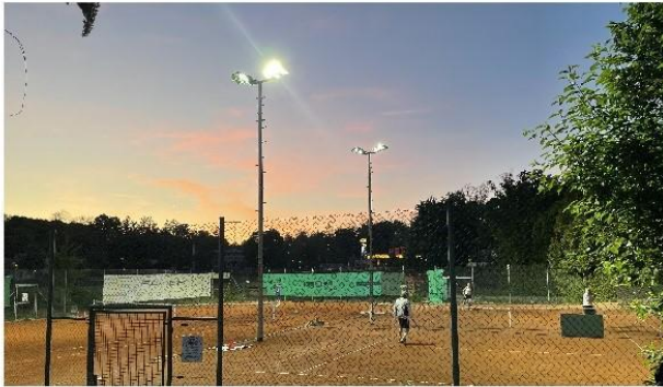
LED-Flutlichtanlage der Tennisabteilung des TSV Nieder-Ramstadt e.V.

Lumosa ist ein führender Hersteller von LED-Beleuchtung mit über 17 Jahren Erfahrung in der Entwicklung und Produktion von LED-Hochleistungsflutern.